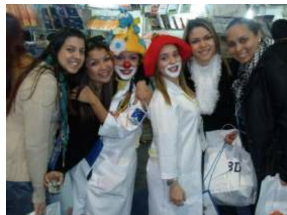
Posando para foto com enfermeiros performáticos