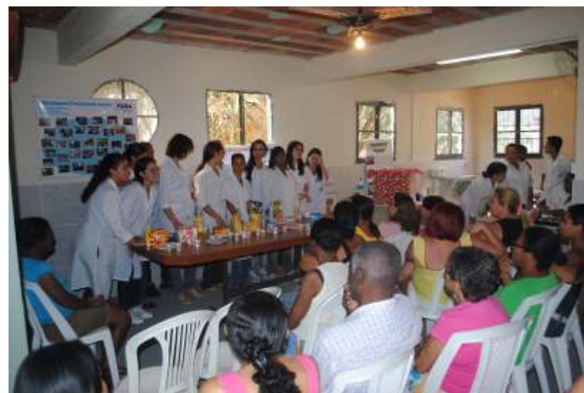
Alunas de nutrição apresentam palestra