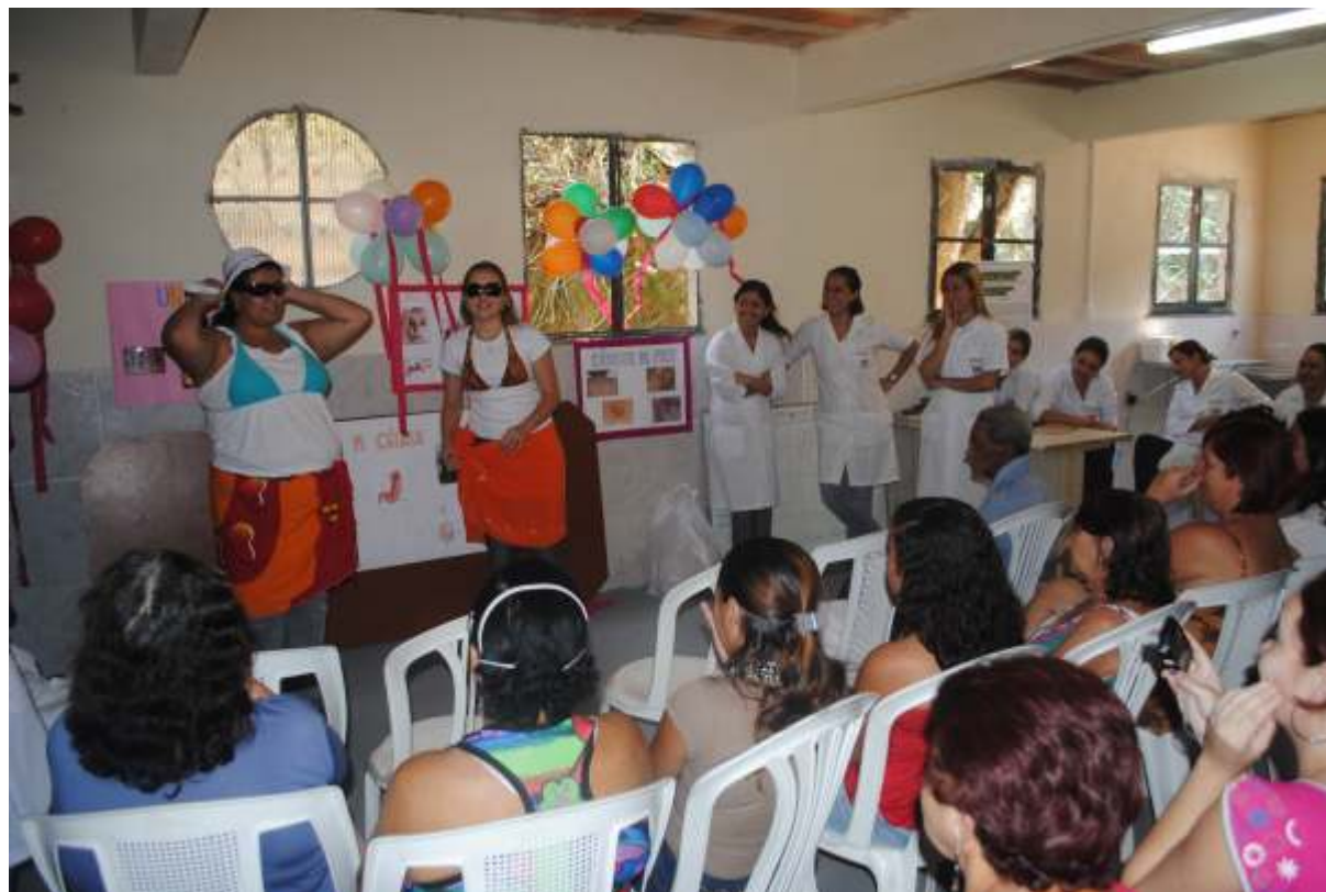
Houve apresentação teatral para ilustrar as palestras