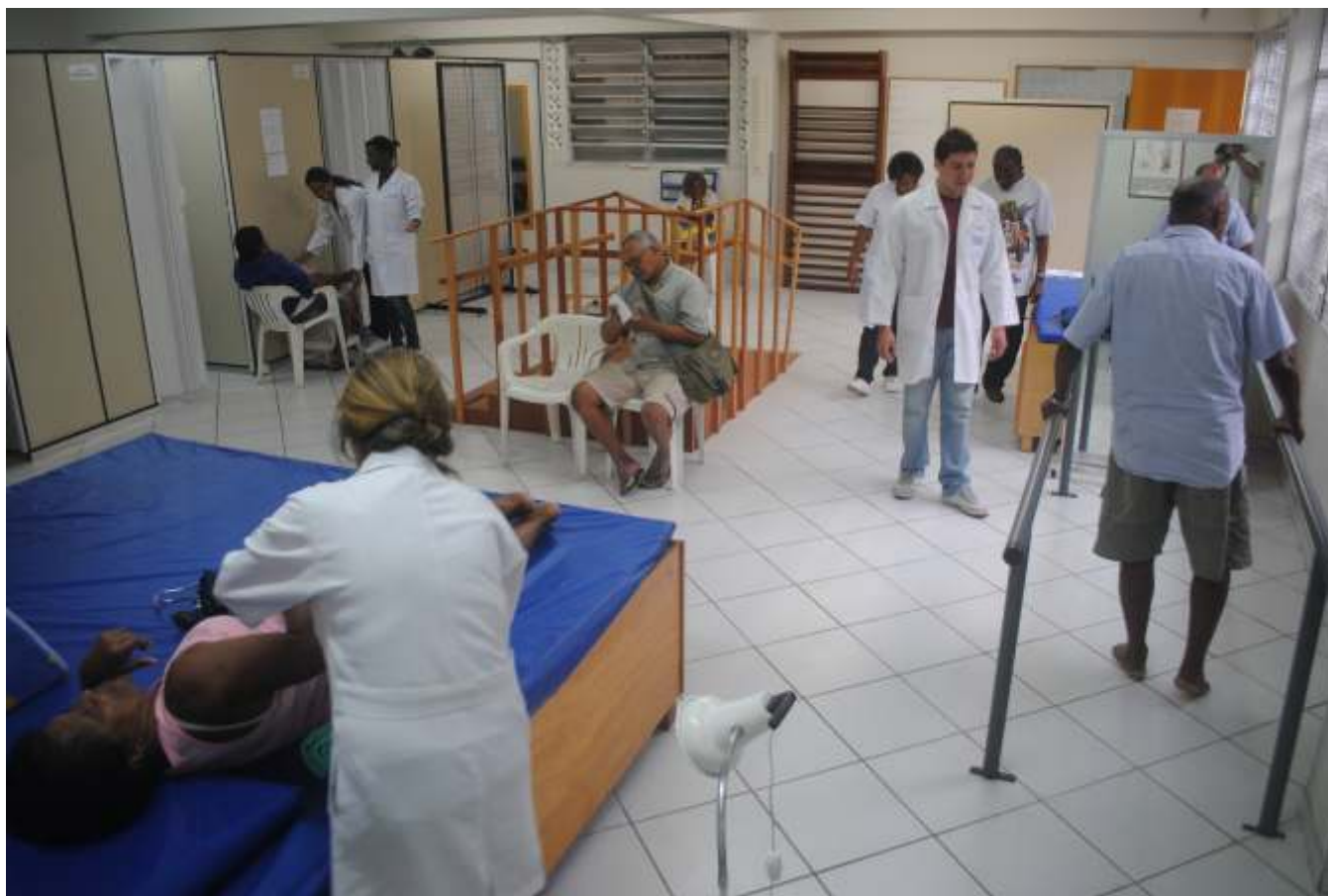
Uma visão panorâmica das instalações da clínica

Além de oferecer consultas, exames e internações, o sistema também promove campanhas de vacinação e ações de prevenção e de vigilância sanitária – como fiscalização de alimentos e registro de medicamentos –, atingindo, assim, a vida de cada um dos brasileiros. A Constituição de 1988 foi um marco na história da saúde pública brasileira, ao definir a saúde como "direito de todos e dever do Estado".