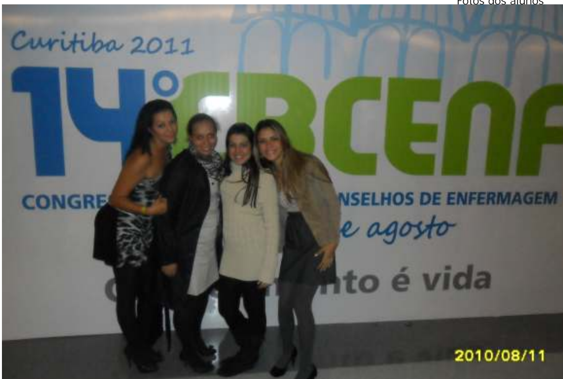
A foto diante do painel do evento não podia faltar