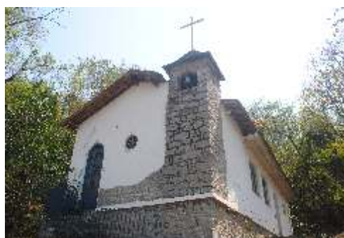
A igreja da bairro

A Faba mantém um posto de atendimento no bairro São Jerônimo, em Campo Grande. Os alunos realizam diversos serviços e atividades de saúde onde estimulam a prevenção de várias doenças e enfermidades. As quatro graduações atuam no local: enfermagem, nutrição, fisioterapia e farmácia.