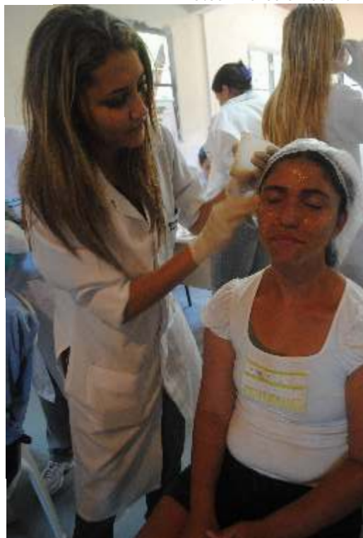
Aluna realiza máscara facial na moradora