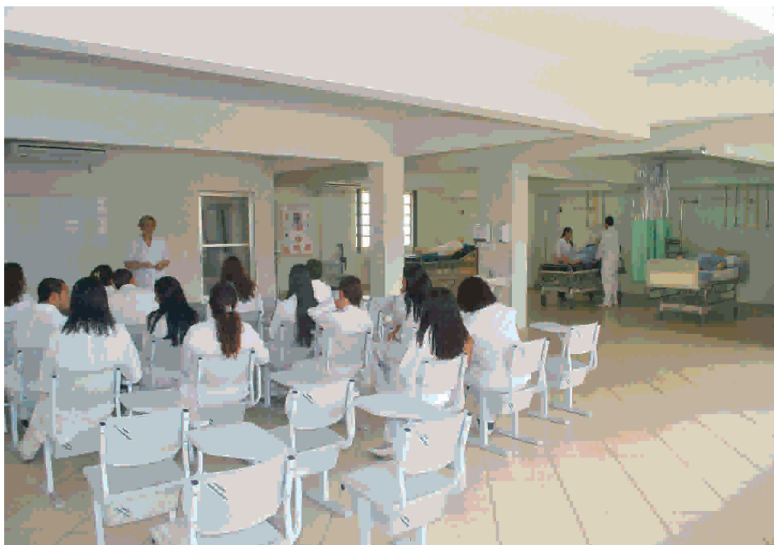
O CT de enfermagem