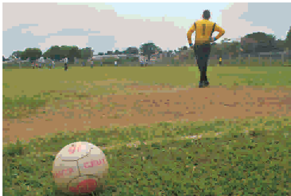
O clube ainda não possui centro de treinamento