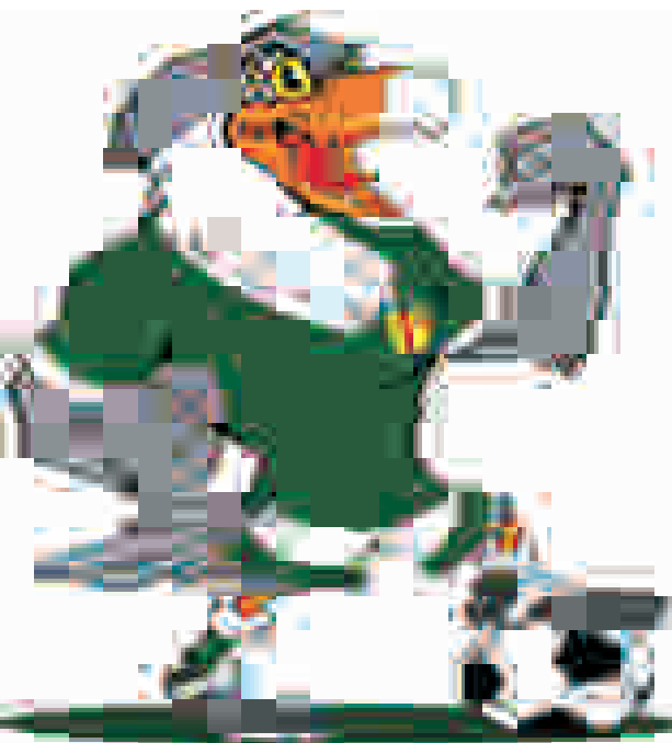
O símbolo do clube