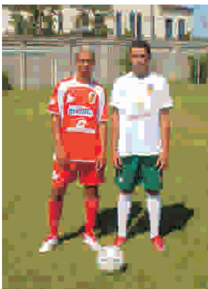
Os uniformes do time

Alguns jovens jogadores formados no Santa Cruz estão treinando em grandes clubes da cidade, como Flamengo e Fluminense, à espera de uma oportunidade para se destacar no mundo do futebol e realizar o sonho de jogar no Maracanã. "A gente forma parcerias com outros clubes maiores e essa é uma maneira de obter recursos para continuar investindo e seguindo com nosso projeto", explica ele.