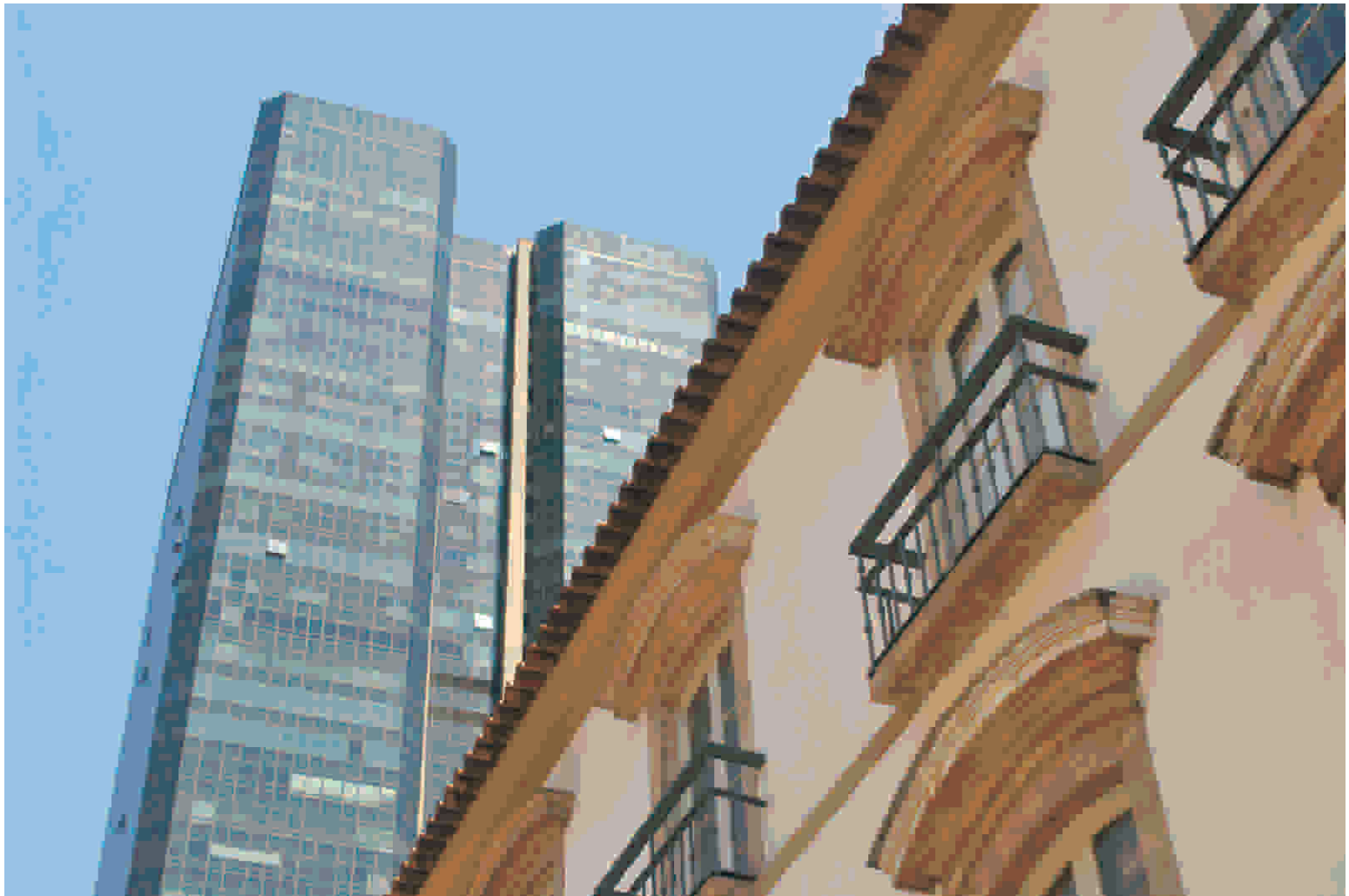
O moderno e o antigo convivem no centro da cidade