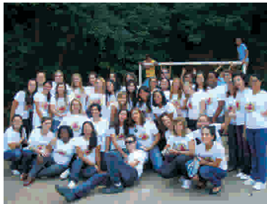
Os alunos na comunidade São Jerônimo

Um meio de incentivar os alunos foi a comemoração do Dia do Nutricionista, em 31 de agosto. E para celebrar esta data, as alunas do 8º período de Nutrição prepararam um café da manhã caprichado.