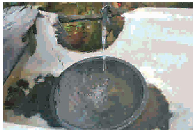
A fonte de água natural do sítio