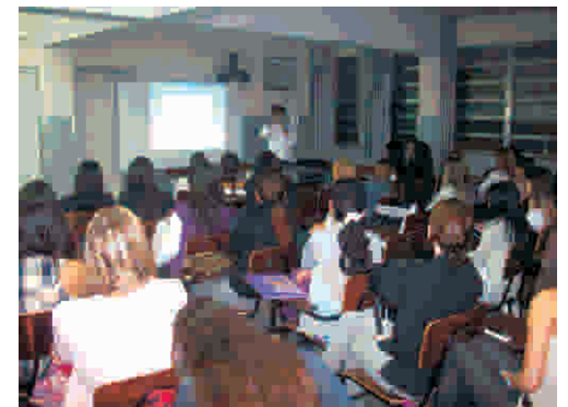
A Semana de Nutrição teve diversas atividades