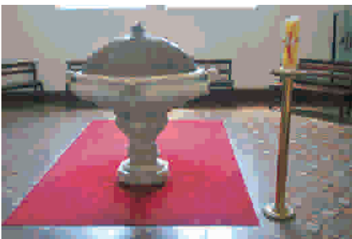
A pia onde foi batizada Princesa Isabel

“O passeio foi excelente. Eu sempre quis conhecer esses lugares da cidade, mas não sabia como fazer. O Rio de Janeiro é uma cidade que guarda a história do país, pois foi aqui que tudo começou”,