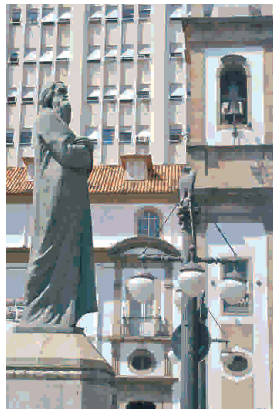
A mistura dos estilos arquitetônicos do centro da cidade