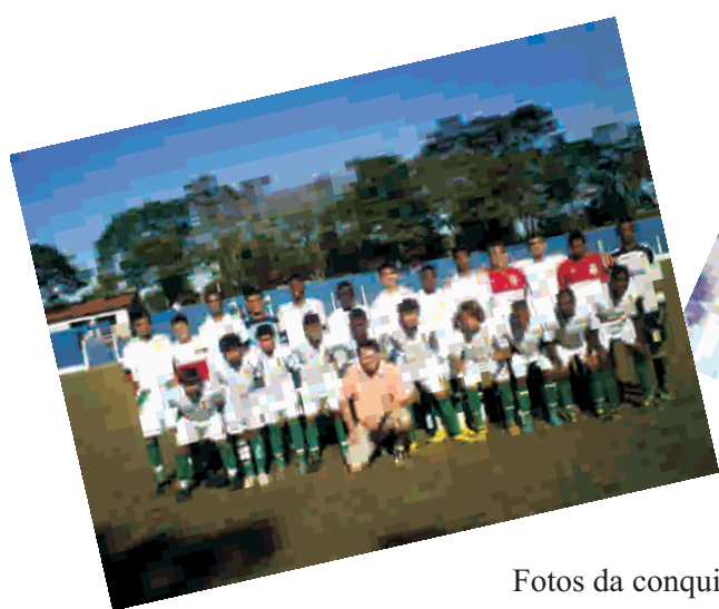
Fotos da conquista do mundialito

Apesar de ser um clube muito novo, o Santa Cruz já conquistou um título importante na categoria até 18 anos. "Vencemos o Primeiro Mundialito de Conchal, em São Paulo, em agosto, quando disputamos com 12 clubes, inclusive times da Bolívia e da Colômbia", conta o presidente, que empolgado com o resultado, ressalta: "Fomos campeões invictos e levamos apenas quatro gols". Mas nem tudo são excelentes resultados e comemorações. "A gente faz o trabalho com muito boa vontade e chega a investir no clube, pois temos custos com transporte, federação e entre outras coisas", conta ele.