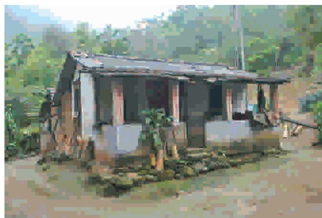
A casa do casal, construída pelo próprio Genaro