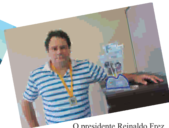
O presidente Reinaldo Frez