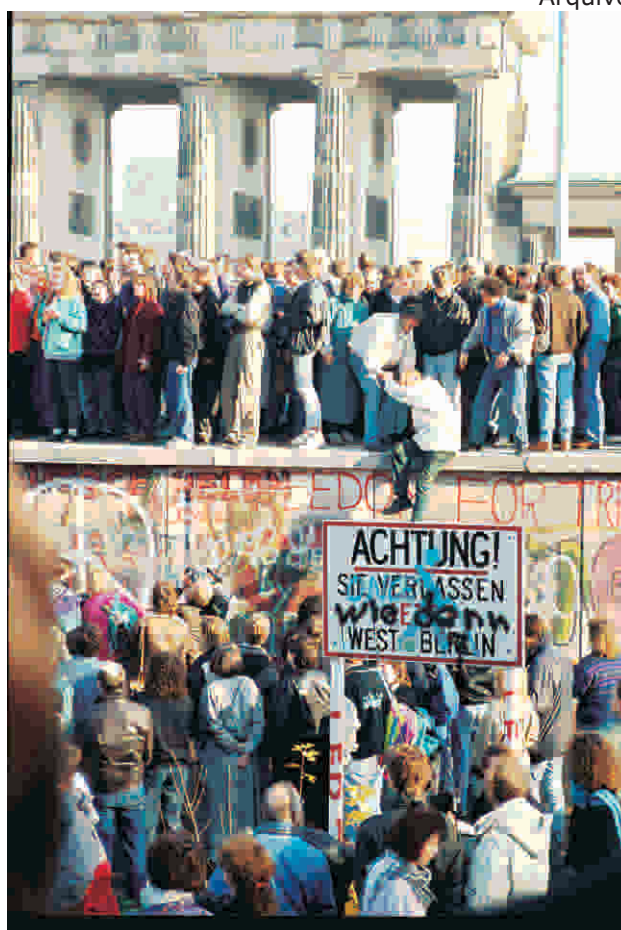
Alemães protestam pela queda do muro