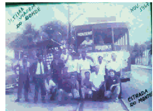
Última viagem de bonde em 1967