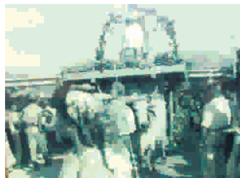
Desfile da última Rainha da Lavoura na inauguração do viaduto

sesmarias, viraram produtores de laranja, cana-de-açúcar, banana, milho e hortaliças, além de, durante longo período, também investiram em pecuária, formando o maior rebanho de cabeças de gado da cidade, sendo um dos principais fornecedores de alimentos para a população carioca. "Os bondes serviam de transporte para os lavradores que faziam a colheita do Rio da Prata e da Ilha de Guaratiba", conta Ernesto.