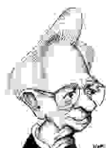
Itamar Franco 1992/94