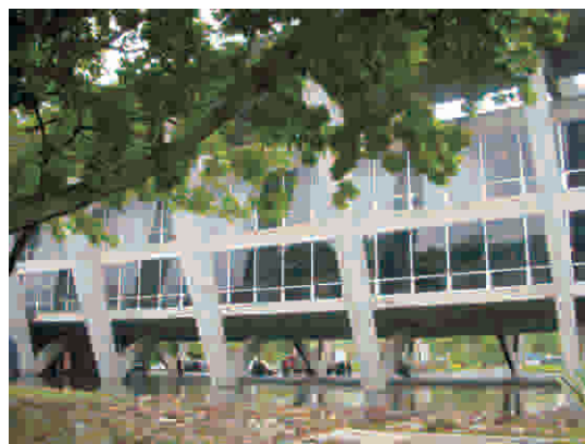
MAM do Rio, também projetado por Affonso Eduardo Reidy