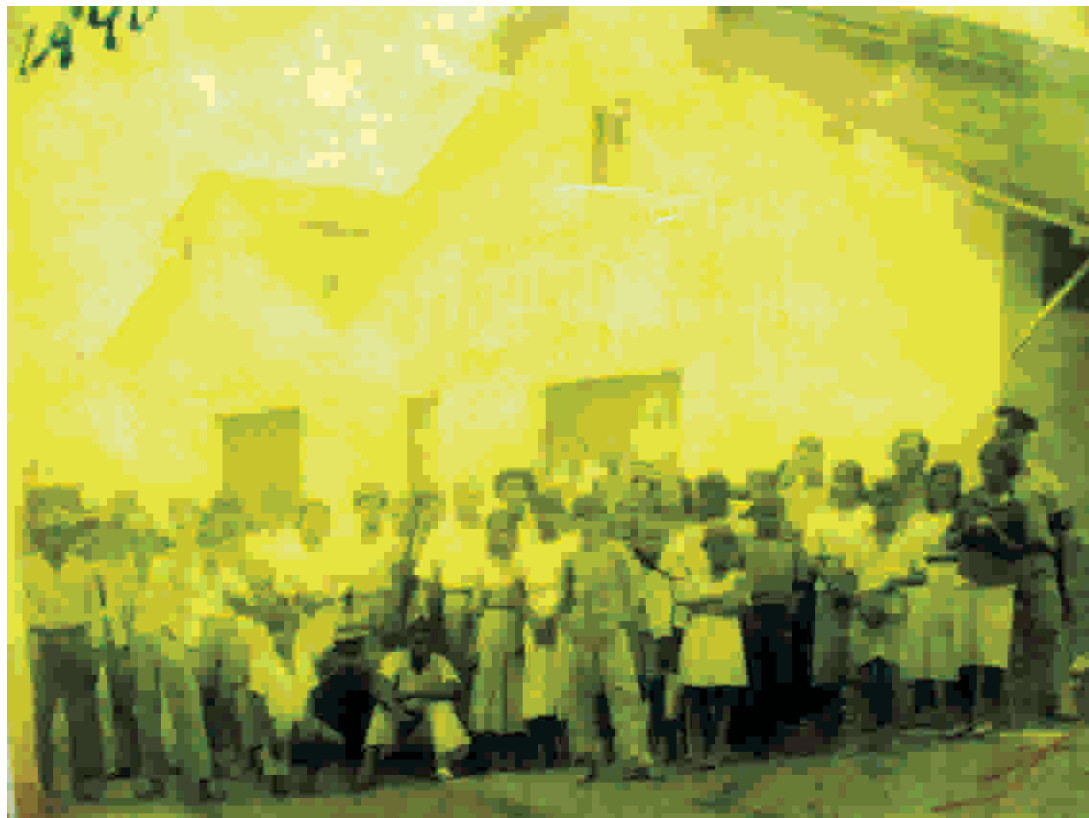
Operários e familiares em frente ao barraco da laranja