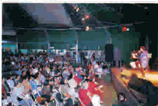
Show de Cauby Peixoto