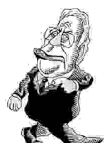
Fernando Henrique 1994/98