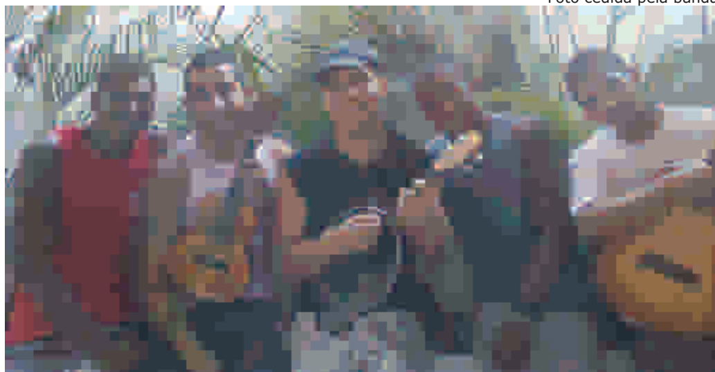
Os integrantes da banda Stylo A+