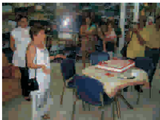
Declamação de poesia