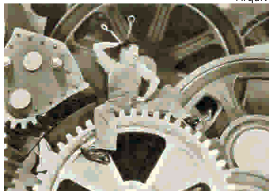
Cena do filme Tempos Modernos, de Charles Chaplin

A situação mudou profundamente nas sociedades atuais. O mercado requer um trabalhador repleto de competências e habilidades, pronto para ser flexível, maleável, resolutivo diante de situações fortuitas, ou seja, não mais corriqueiras ou repetitivas como eram nas sociedades industriais da Era Moderna. Ora, mediante essa mudança, o trabalhador está condenado à educação permanente e continuada, em constante upgrade e update , de forma que pode ficar a qualquer momento obsoleto. A curta durabilidade do conhecimento e das técnicas é um fator estressante e perigoso. É o lado morto do trabalho pós-moderno, uma vez que o trabalhador deve estar sempre adaptado a situações flutuantes, gerando ansiedade e insegurança. No entanto, tal fato não é produzido de forma deliberada pelas empresas, pois é uma tendência do mercado. Empresas e trabalhadores estão condenados ao eterno upgrade e update .