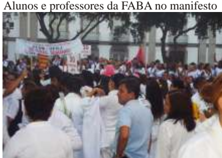
Alunos e professores da FABA no manifesto