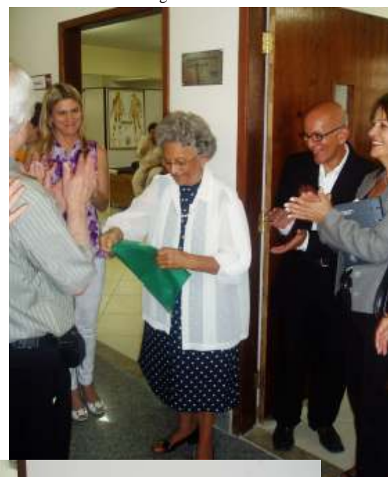
Momentos das homenagens nas salas