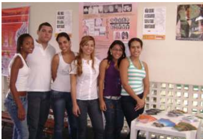
Alunos apresentando seus trabalhos sobre drogas

e divergências. Mas isso é bom, pois na nossa profissão estaremos sempre lidando com pessoas diferentes nos plantões”.