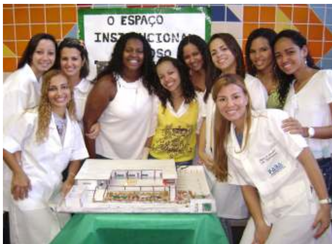
Alunas apresentando seus trabalhos em maquete