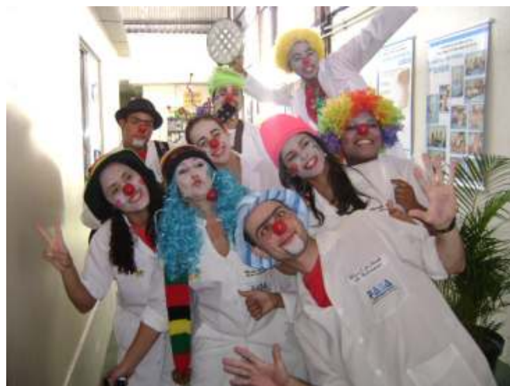
O grupo Enfermalaria também esteve presente